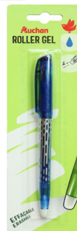
Exemples de stylos effaçables + recharges