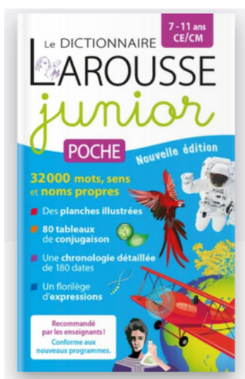
Dictionnaire LAROUSSE junior (si il y en a déjà un à l'école, pas nécessaire d'en acheter un neuf)